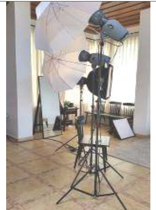
關島唯一 Studio 場景