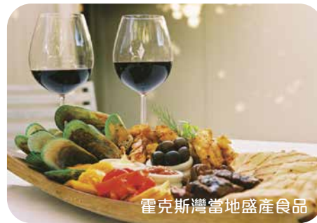
霍克斯灣當地盛產食品